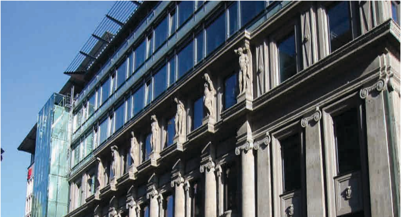
Bilder: g 2

Für das Büro ZSP Architekten Zinsmeister Scheffler und Partner war die städtebauliche Zielsetzung die Zusammenfassung der zum Gesamtkomplex gehörenden Gebäude zu einem Büro- und Dienstleistungszentrum in der Stuttgarter Innenstadt. Dabei wurde die Charakteristik der einzelnen Häuser gewahrt, durch ein übergreifendes Gestaltungskonzept jedoch ein Zusammenhang hergestellt. Die Neugestaltung der Fassade über dem historischen Bestand in der Schloßstraße 20, die Aufstockung des Gebäudes um ein Vollgeschoss und das deutlich auskragende Dach sind Elemente, die das Gebäudeensemble zusammenfassen. Herausforderung für die Bauleistungen war unter anderem die historische Bausubstanz und die Integration des neuen Hauptmieterausbau Börse Stuttgart im laufenden Bauprozess.